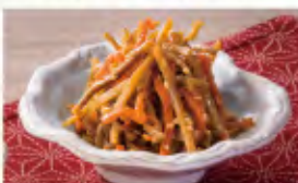
きんぴらごぼう 300円(税込330円)