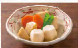
炊きあわせ 590円(税込649円)