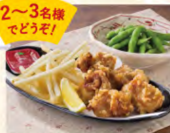
おつまみセット 990円(税込1,089円)