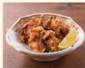
ざんぎ3個(鶏のから揚げ) 490円(税込539円)