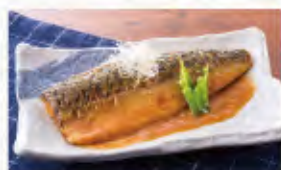
さばの味噌煮 620円(税込682円)