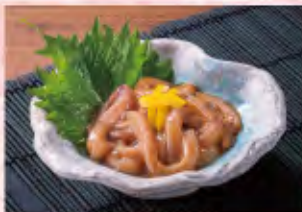
とんでん特製いか塩辛 420円(税込462円)