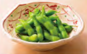
北海道十勝産枝豆 340円(税込374円)