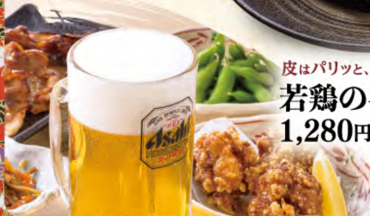
皮はパリッと、肉はジューシー~! 若鶏の半身揚げ 1,280円(税込1,408円)