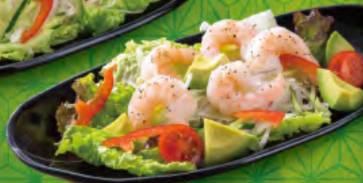
えびと アボカドの サラダ 690円 (税込759円)