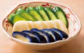
新漬盛合せ 420円(税込462円)