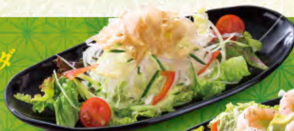
オニオンサラダ 490円(税込539円)