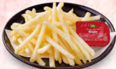
フライドポテト 440円(税込484円)