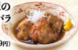
富良野産豚の とろ〜り豚バラ 軟骨煮 590円(税込649円)