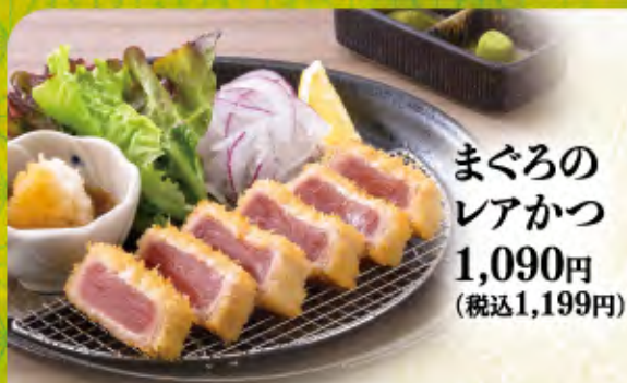
まぐろの レアかつ 1,090円 (税込1,199円)