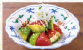
漬けまぐろとアボカドの おつまみポキ 590円(税込649円)