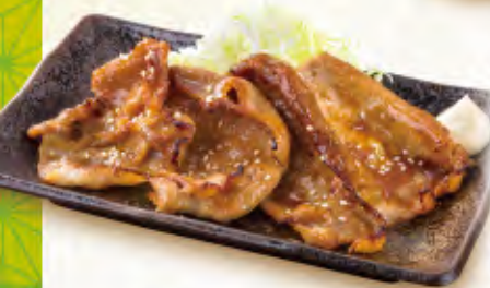
北海道産 豚ロース 生姜焼き 690円 (税込759円)